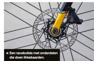
◀ Een racebolide met onderdelen die doen likkebaarden.